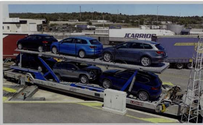
Links: Der neu entwickelte Lkw-Aufleger für Autotransporte auf einem Lohr-UIC-Wagen.

Lohr produziert nicht nur Bahnwagen, sondern ist vor allem auch einer der bedeutendsten Hersteller von Auflegern für Pkw-Strassentransporte. Neuerdings hat das Unternehmen einen Lkw-Aufleger im Lieferprogramm, der mit sechs Pkw auch auf den Lohr-UIC-Wagen passt. Bereits haben Tests für den Autohersteller Seat stattgefunden. Neuwagen ab dem Werk Martorell bei Barcelona könnten so einen Grossteil der Strecke zu den Händlern per Bahn zurücklegen. (lüt/meil/mr)