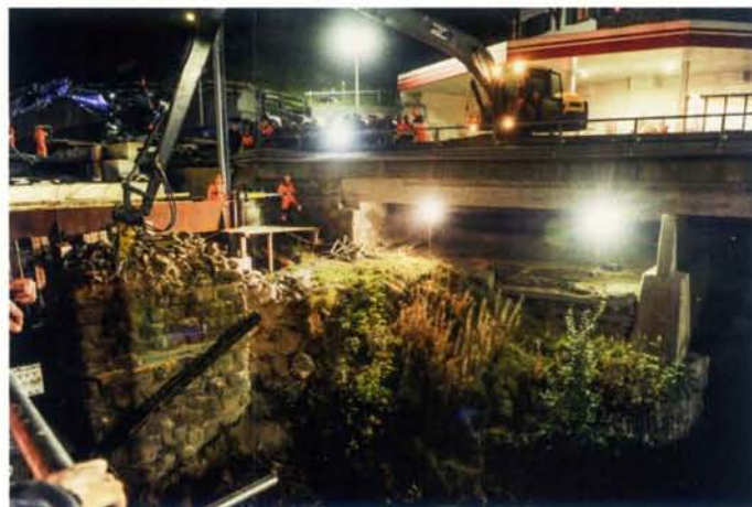
Von der Strassenbrücke aus erfolgt der Abbruch der alten Widerlager.