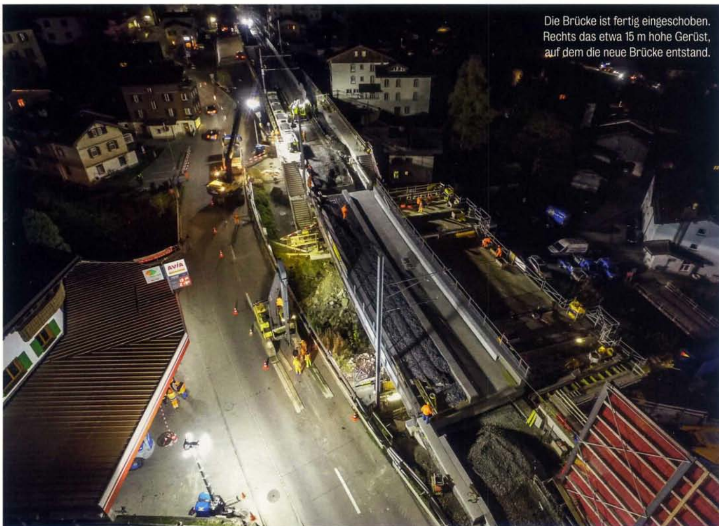
Die Brücke ist fertig eingeschoben. Rechts das etwa 15 m hohe Gerüst, auf dem die neue Brücke entstand.

In der Nacht vom Samstag, dem 15., auf Sonntag, den 16. Oktober 2022, erfolgte in Klosters Dorf ein Brückeneinschub. Der letzte Zug der Rhätischen Bahn (RhB) überquerte die alte Stahlbrücke sowie die beiden anschliessenden Hilfsbrücken um 18.25 Uhr, und der erste Zug überquerte