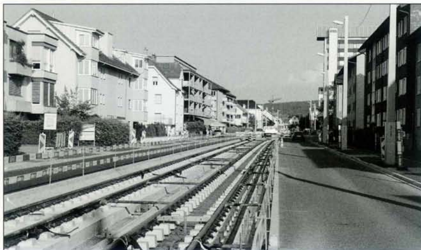
Am 11. Juni 2021 waren in der Badenerstrasse in Dietikon die Schienen weitgehend verlegt.

den Bauarbeiten betroffen sind, verkehrt die Bremgarten – Dietikon-Bahn wieder regulär. An einigen Tagen im November 2021, vor allem an Wochenenden, verkehren allerdings Ersatzbusse, wenn im AVA-Bahnhof Dieti-