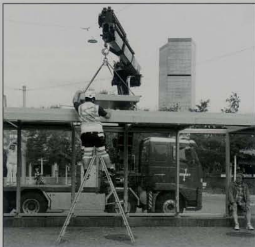
Montage eines Pflanzentroges an der Haltestelle Hardplatz am 26. August 2021.

reichen solchen kleinen Grünflächen die Verbesserung des Mikroklimas und der Biodiversität, nicht zuletzt weil blühende Pflanzen zahlreiche Insekten anlocken. Das Pilotprojekt dauert ein Jahr.